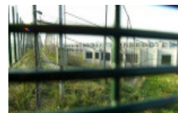
vluchtelingenkamp vandaag (2010)