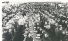
op de vlucht voor de oorlog (1914-18)

Welke activiteit kunnen de revolutionairen ontwikkelen in deze strijd?