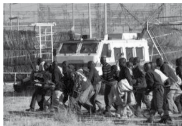
De staking breidt zich uit

Hoewel de propaganda over de "terugkeer van de apartheid" door de arbeiders nooit echt serieus genomen werd, is de strijd in een die context inderdaad weggeëbd. Nochtans, in dit stadium, kent de beweging een nieuw leven.